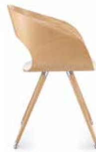
Holz Wood Bois