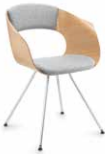
Stahl Steel Acier