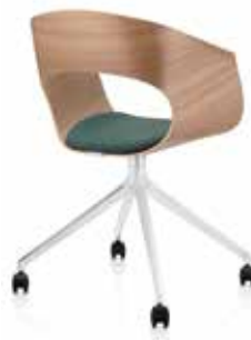
Fusskreuz Cross base Piétement étoile