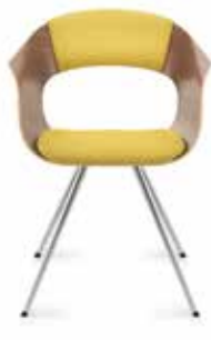
Aluminium Aluminium Aluminium