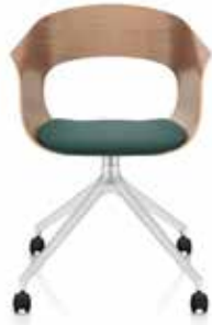
Mit Sitzpolster With seat cushion Avec capitonnage d'assise