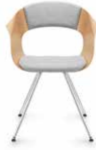
Mit Sitz- und Rückenpolster With seat and backrest cushion Avec capitonnage d'assise et de dossier