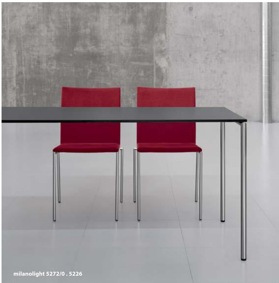
milanolight 5272/0 . 5226

Gestell Rundrohr, verchromt, Plattenoberfläche Eichenfurnier, Amerikanisch-Nussbaumfurnier, Buchenfurnier oder HPL, Verstellgleiter. Optional verschiedene Kantenausführungen, Platte oder Kante gebeizt, Minderhöhe, Gestell beschichtet oder mattverchromt