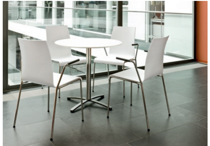
Vielseitige Einsatzbereiche. prime passt zu vielen Situatio- nen – und ist auch ein souveräner Partner für die kleine Runde.