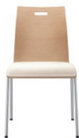
1090 mit Griffloch 5